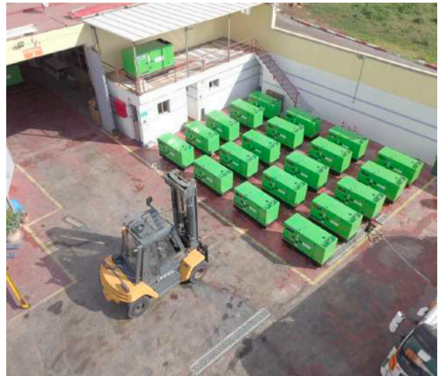
PARC LOGISTIQUE BEWHY · CASABLANCA

L'ambition de BewhY consiste à simplifier l'accès à une énergie performante, économique et responsable, en plaçant chaque client au centre d'une démarche personnalisée, mesurable et continue.